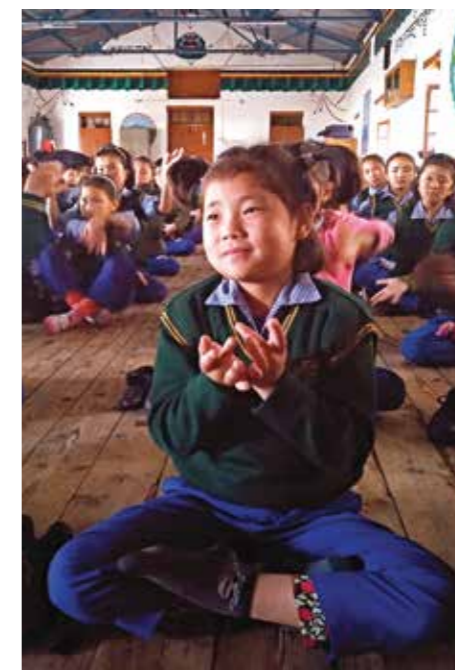
Дети изучают упражнения Фалунь Дафа

Мне всегда было радостно, когда дети, которые уже обучались Фалунь Дафа в своих школах несколько лет назад, с восторгом говорили «Фалунь Дафа несёт добро», когда видели меня на улице или в их новой школе.