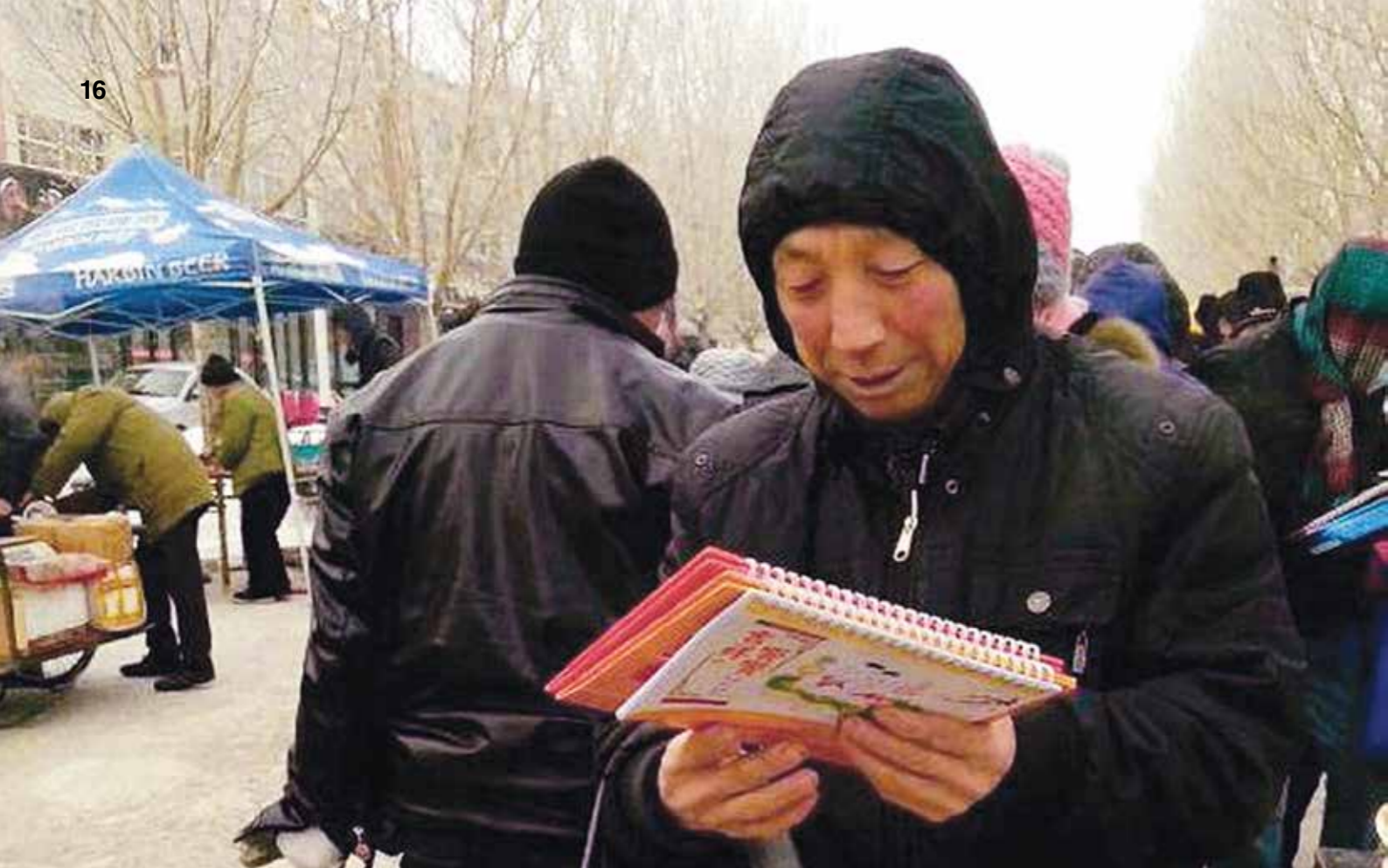
Покупатель на фермерском рынке в Цзямусы провинции Хэйлунцзян получил в подарок настольный календарь «Минхуэй»