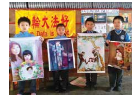
Тибетские дети в Индии узнают о том, что практикующих Фалунь Дафа и их детей преследуют в Китае