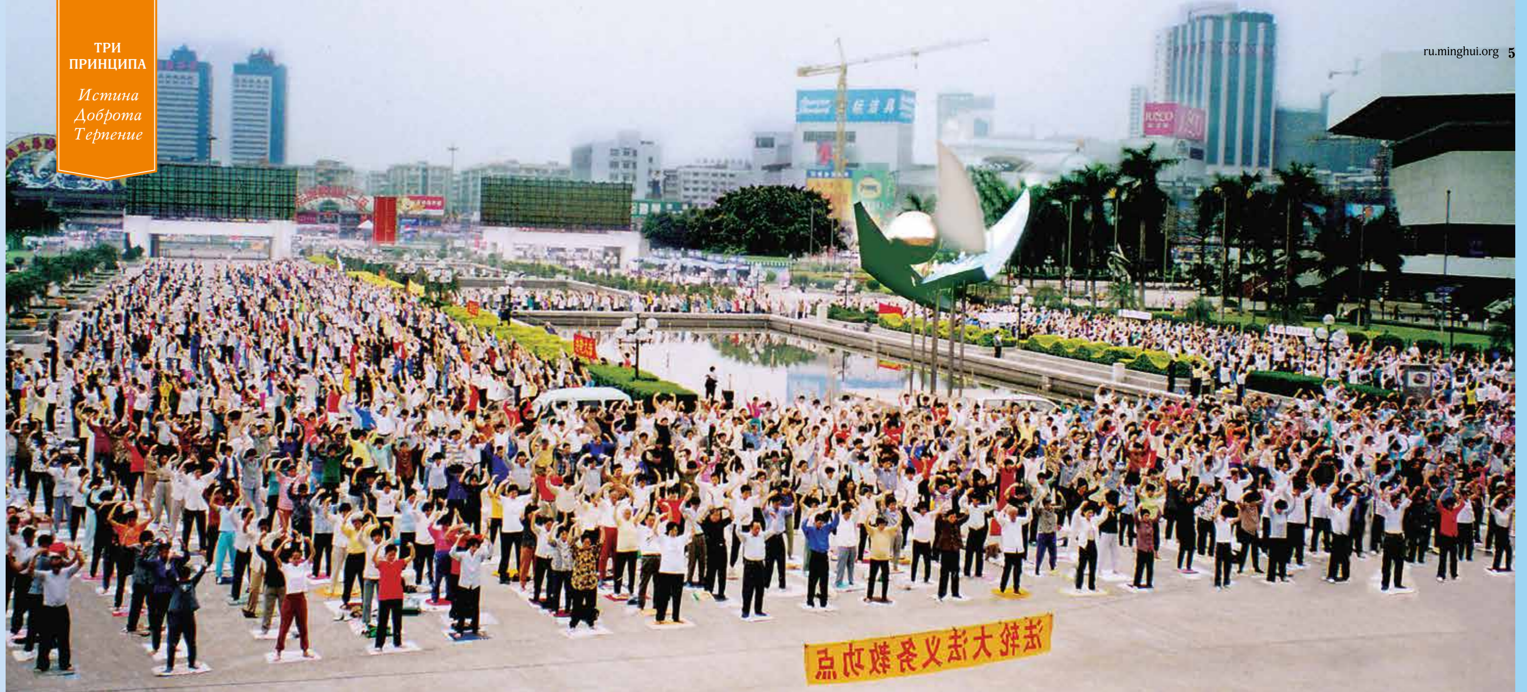
Коллективное выполнение упражнений в Гуанчжоу. Надпись на плакате: «Здесь бесплатно обучают упражнениям Фалунь Дафа»