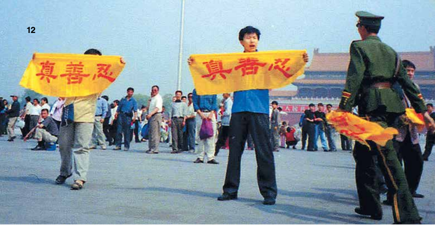
Практикующий держит плакат на площади Тяньаньмэнь