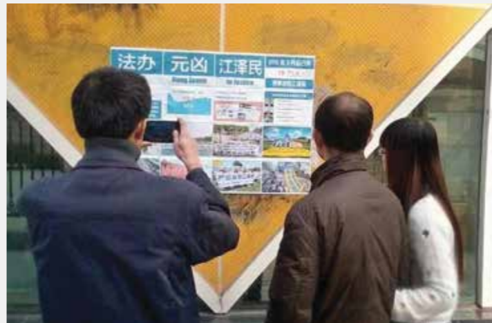
Прохожие в Китае читают плакат с надписью «Привлечь Цзян Цзэминя к правосудию». Цзян Цзэминь – бывший лидер компартии Китая, который отдал приказ о преследовании Фалуньгун

Благодаря защите Учителя я вышел из центра заключения через два месяца. Я стал свидетелем многих чудес Дафа. Никакими словами нельзя выразить мою благодарность Учителю Ли. Я только могу усердно совершенствовать себя.