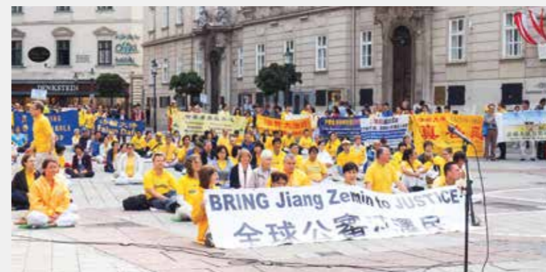
Последователи Фалуньгун в Вене (Австрия) проводят мирную акцию против репрессий в Китае

Кроме того, более миллиона человек по всему миру подписали петицию, призывающую привлечь Цзяна к правосудию. Ведущие политики в мире также выразили свою поддержку. «Мы должны привлечь его к ответственности», – сказал бывший конгрессмен США Д. Рорабахер, который осуждает преследование в Китае.